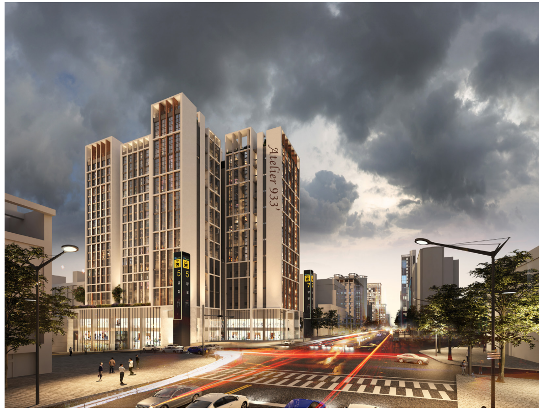
* 소비자의 이해를 돕기 위해 참고용으로 제작한 이미지입니다.